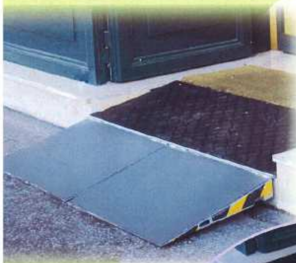
TRAIT D'UNION est un modèle breveté.