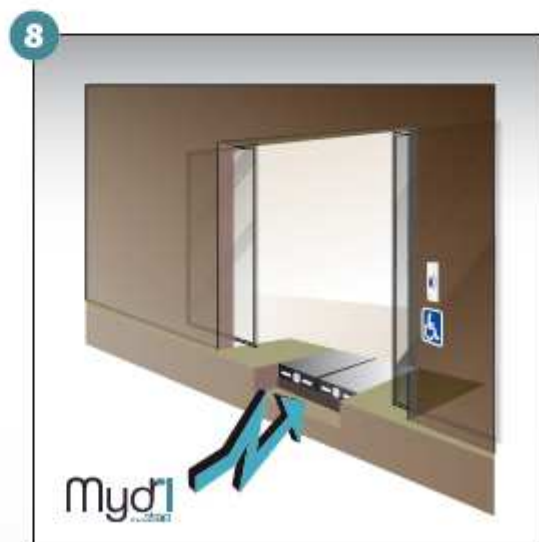
8 - Répéter les manoeuvres précédentes en sens inverse pour fermer la rampe