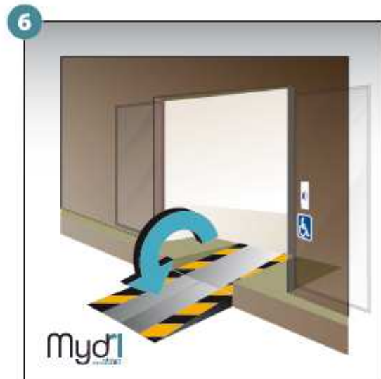
6 - Répéter les opérations pour la deuxième rampe.