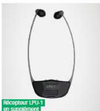
Récepteur LPU-1 en supplément