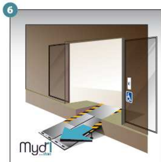
6 - Répéter les opérations pour le deuxième volet