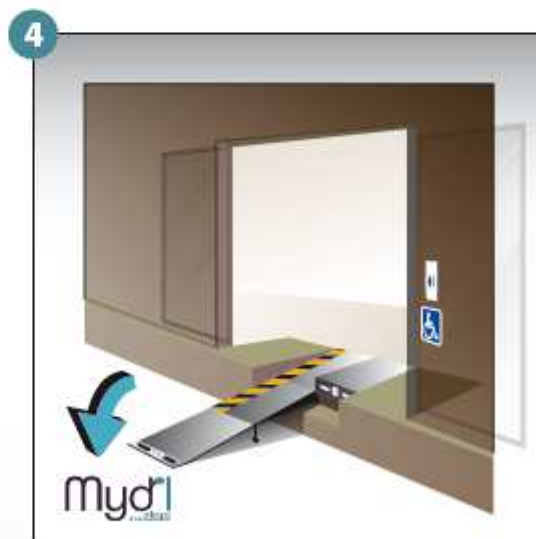
4 - Poser la rampe au sol.

ATTENTION : vous devez refermer la rampe après chaque utilisation Déploiement manuel de la rampe d'accès