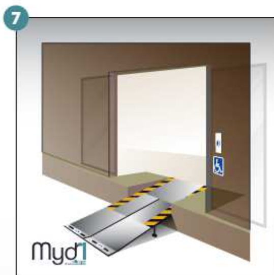
7- Rampe en service