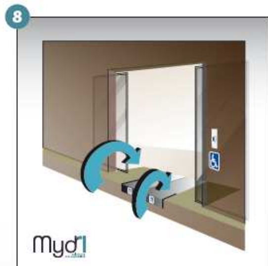
8 - Répéter les manoeuvres précédentes en sens inverse pour fermer la rampe.