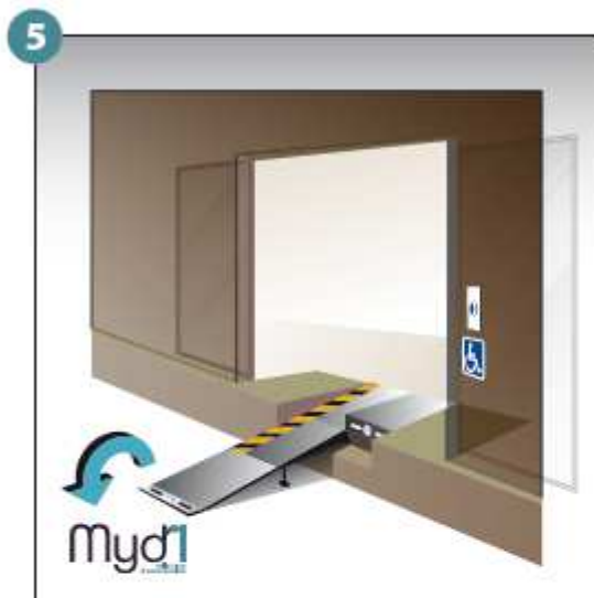
5 - Basculer la poignée qui prolongera la rampe