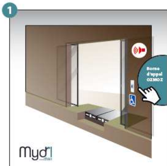
1 - Appel et prise en considération de la personne à mobilité réduite