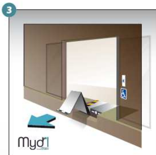
3 - Tirer le volet vers l'avant des deux mains.