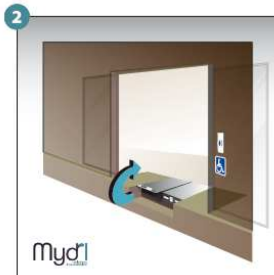
2 - Soulever le volet frontal.