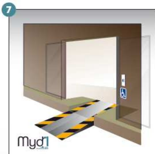
7- Rampe en service.