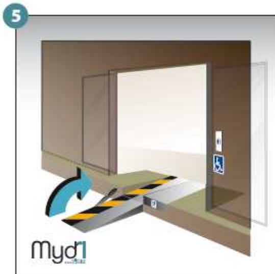
5 - Basculer la poignée qui fera office de chasse roues.