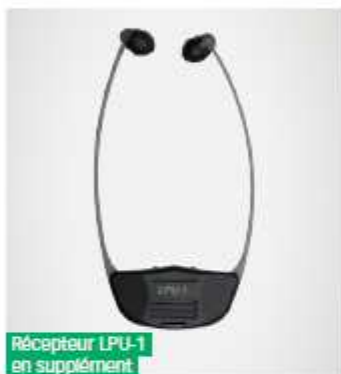
Récepteur LPU-1 en supplément