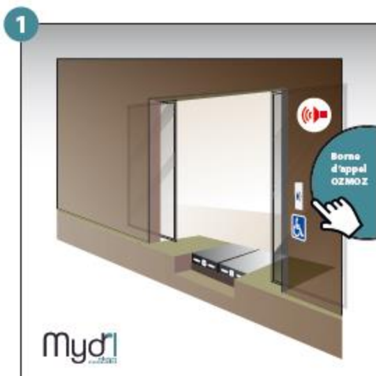
1 - Appel et prise en considération de la personne à mobilité réduite