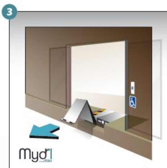
3 - Tirer le volet vers l'avant des deux mains.