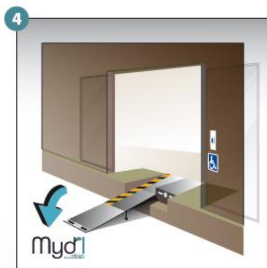
4 - Poser la rampe au sol.

ATTENTION : vous devez refermer la rampe après chaque utilisation Déploiement manuel de la rampe d'accès