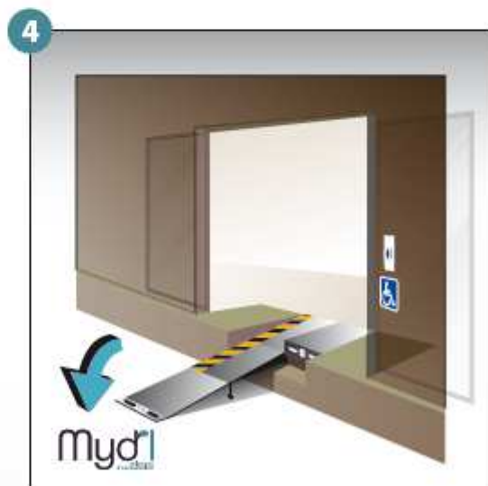
4 - Poser la rampe au sol.

ATTENTION : vous devez refermer la rampe après chaque utilisation Déploiement manuel de la rampe d'accès