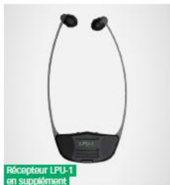
Récepteur LPU-1 en supplément