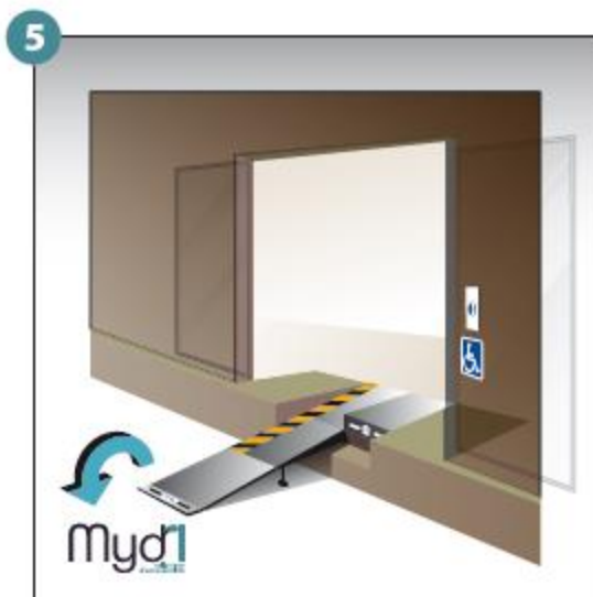
5 - Basculer la poignée qui prolongera la rampe