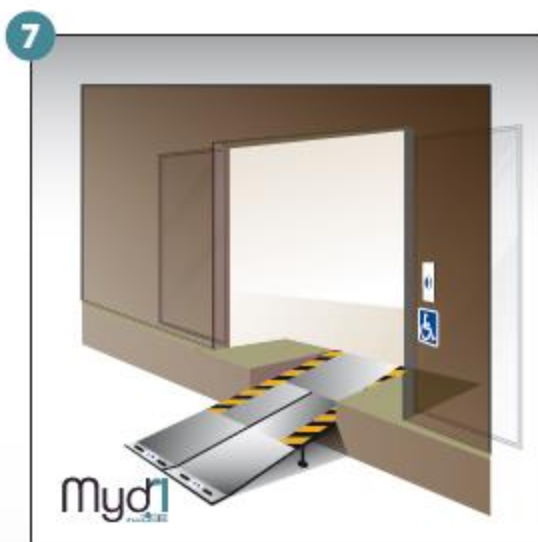
7- Rampe en service