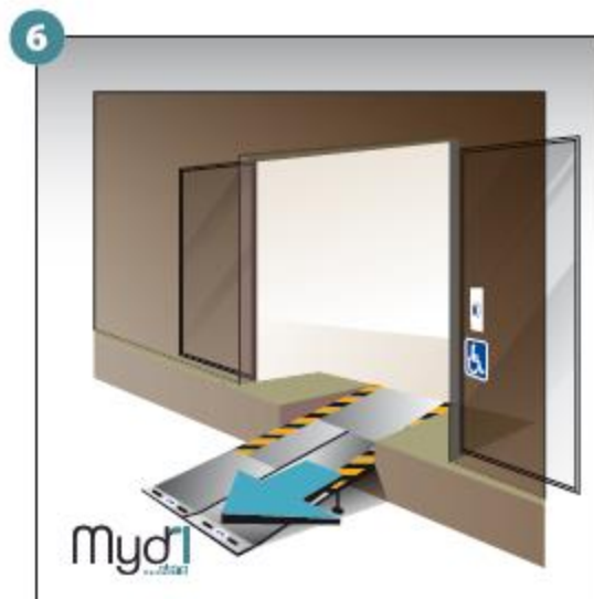
6 - Répéter les opérations pour le deuxième volet