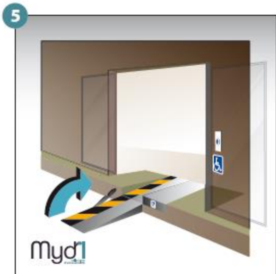
5 - Basculer la poignée qui fera office de chasse roues.