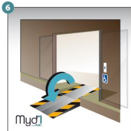
6 - Répéter les opérations pour la deuxième rampe.