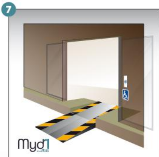
7- Rampe en service.