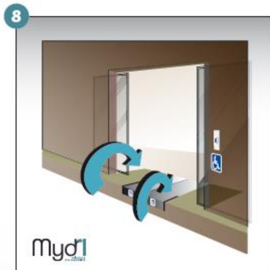
8 - Répéter les manoeuvres précédentes en sens inverse pour fermer la rampe.