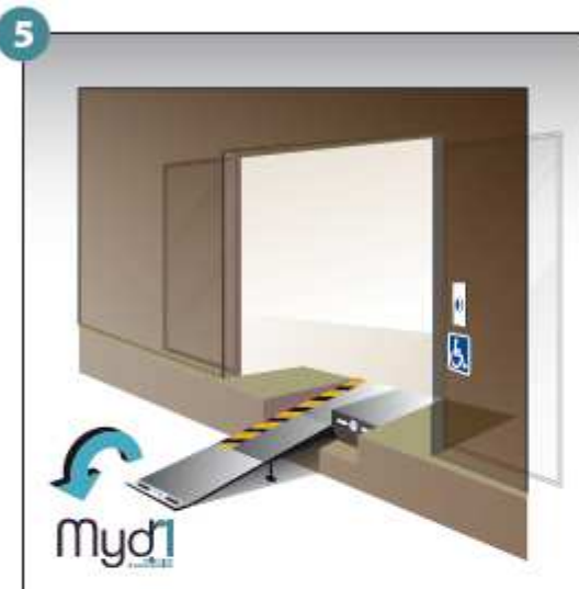
5 - Basculer la poignée qui prolongera la rampe