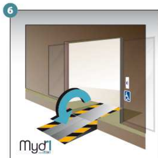
6 - Répéter les opérations pour la deuxième rampe.