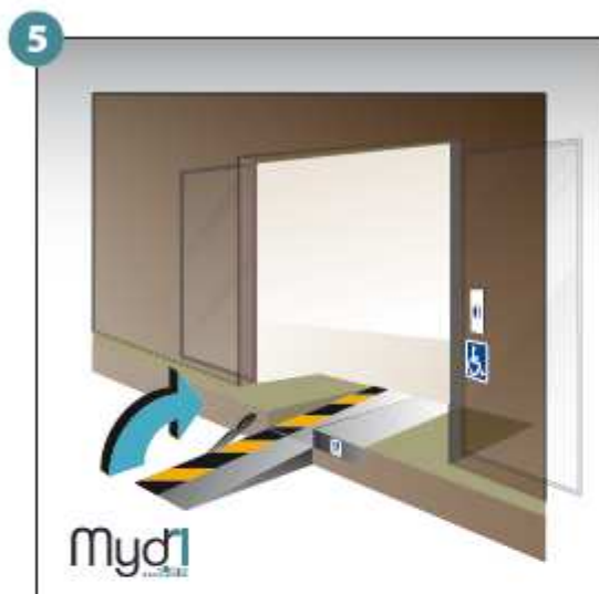
5 - Basculer la poignée qui fera office de chasse roues.